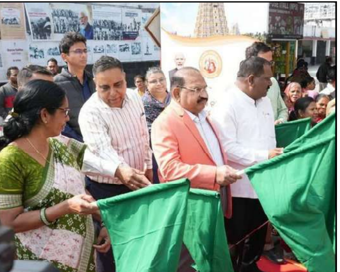
ଯାତ୍ରାଙ୍କ ପାଇଁ ଖାଦ୍ୟ, ପାନୀୟ, ଯିବା ଆସିବା ଏବଂ ଆଶ୍ରୟସ୍ଥଳୀର ବ୍ୟବସ୍ଥା କରାଯାଇଛି । ଏହା ସହ ଏକ ଡାକ୍ତରୀ ଟିମ୍ ଏବଂ ୨୫ ଜଣ ଏକକର୍ତ୍ତ୍ୱ ଅଧିକାରୀ ମଧ୍ୟ ସେମାନଙ୍କ ସହ ଯାତ୍ରା କରିଛନ୍ତି । ସମ୍ବଲପୁର ରେଳ

ସମ୍ବଲପୁର : ରାଜ୍ୟ ପର୍ଯ୍ୟଟନ ବିଭାଗ, ରେଳବାଇ ଏବଂ ଜିଲ୍ଲା ପ୍ରଶାସନ ମିଳିତ ସହଯୋଗରେ, 'ବରିଷ୍ଠ ନାଗରିକ ତୀର୍ଥଯାତ୍ରା ଯୋଜନା' ଅଧୀନରେ ପଶ୍ଚିମ ଓଡ଼ିଶାର ୮ ଜିଲ୍ଲାରୁ ୭୭୫ ଜଣ ତୀର୍ଥଯାତ୍ରୀ ସମ୍ବଲପୁରରୁ ତାମିଲନାଡୁର ରାମେଶ୍ୱରମ ଓ ମଦୁରାଇ ଅଭିମୁଖେ ଯାତ୍ରା କରିଛନ୍ତି । ଏହି ଯାତ୍ରାରେ ସମ୍ବଲପୁର ଜିଲ୍ଲାରୁ ୮୯, ସୁବର୍ଣ୍ଣପୁରରୁ ୫୨, ଦେଓଗଡ଼ ୨୭, ଅନୁଗୁଳ ୧୦୯ ଜଣ, ଝାରସୁଗୁଡ଼ା ୫୦, ସୁନ୍ଦରଗଡ଼ ୧୮୦, ବଲାଙ୍ଗିର ୧୪୧, ବରଗଡ଼ ୧୨୭ ଜଣ ଯାତ୍ରୀ ରହିଛନ୍ତି । 'ଆଇଆରସିଟିସି' ପକ୍ଷରୁ ସମସ୍ତ