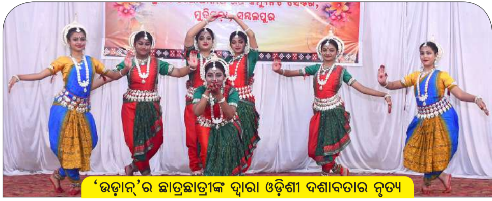
'ଉଡ଼ାନ'ର ଛାତ୍ରଛାତ୍ରୀଙ୍କ ଦ୍ଵାରା ଓଡ଼ିଶୀ ଦଶାବତାର ନୃତ୍ୟ