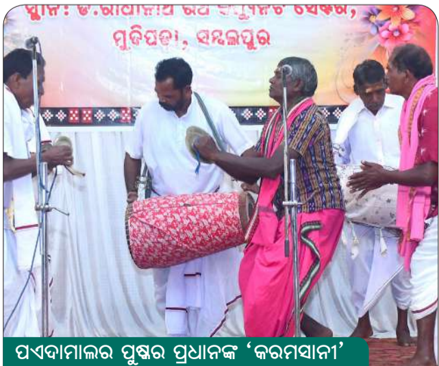
ପଦ୍ମନାଭଲର ପୁଷ୍କର ପ୍ରଧାନଙ୍କ 'କରମସାନି'