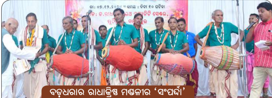
ବଡ଼ଧରାର ରାଧାକ୍ରିଷ୍ଣ ମଣ୍ଡଳୀର 'ସଂପଦା'