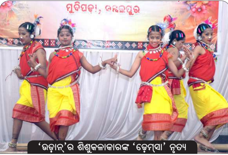
'ଉଡ଼ାନ'ର ଶିଶୁକଳାକାରଙ୍କ 'ଡ଼େମ୍ପା' ନୃତ୍ୟ