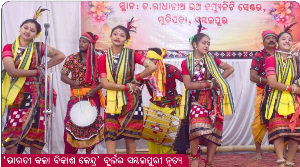
'ଭାରତୀ କଳା ବିକାଶ କେନ୍ଦ୍ର' ବୁର୍ଲାରେ ସମ୍ବଲପୁରୀ ନୃତ୍ୟ