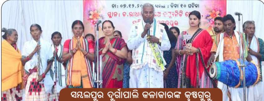
ସମ୍ବଲପୁର ଦୁର୍ଗାପାଲି କଳାକାରଙ୍କ କୃଷ୍ଣଗୁରୁ