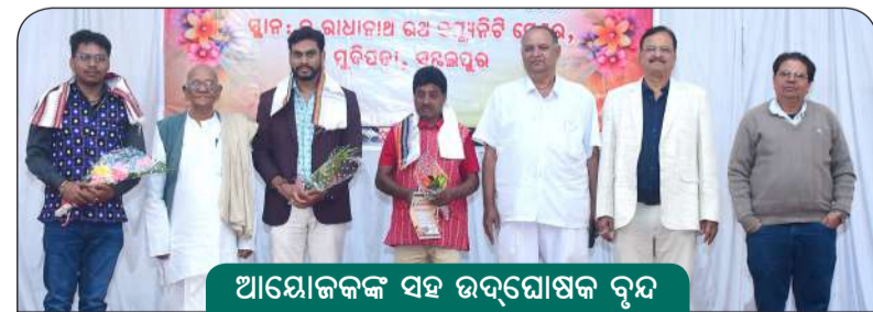
ଆୟୋଜକଙ୍କ ସହ ଉଦ୍ଘୋଷକ ବୃନ୍ଦ