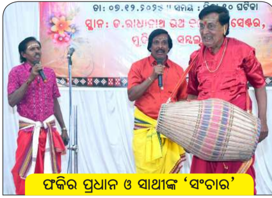
ଫକିର ପ୍ରଧାନ ଓ ସାଥୀଙ୍କ 'ସଂଗାର'