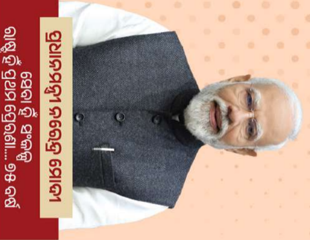
ପ୍ରଧାନମନ୍ତ୍ରୀ ନରେନ୍ଦ୍ର ମୋଦୀ