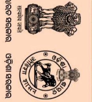
ଭାରତ ସରକାର, ଓଡ଼ିଶା ସରକାର