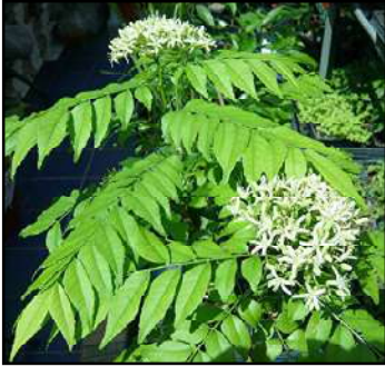
ଆମେ ଜାଣିବା ଦରକାର ।

କେହି କହନ୍ତି ଭୂସୂକ୍ଷ୍ମ ଗଛ ତ କେହି କେହି କହନ୍ତି ଭୂସୂକ୍ଷ୍ମା ଗଛ । ସୁରଭି, ଗିରି ନିୟ, କାଟିନମ, କାରିଆପେଲା, କାରେପେଲ ପରି ଅନ୍ୟାନ୍ୟ ଭାରତୀୟ ଭାଷାରେ ମଧ୍ୟ ଏହାର ପୃଥକ ନାଁ ରହିଛି । ଏହା ଏକ ସୁବାସିତ ପତ୍ରଯୁକ୍ତ ବୃକ୍ଷ । ଅତିବେଶାରେ ପଞ୍ଚ'ଛ ମିଟର ଯାଏ ଏହା ବଢ଼ିପାରେ । ବିଭିନ୍ନ ପ୍ରକାର ଖାଦ୍ୟ ପ୍ରସ୍ତୁତି ବେଳେ ଭୂସୂକ୍ଷ୍ମ ପତ୍ରକୁ ସାଧାରଣତଃ ବ୍ୟବହାର କରାଯାଇଥାଏ । ସମ୍ବର, ରସମ, କଢ଼ି, ରଚଣି, ଛଣାଛଣି କରିବା ପାଇଁ ଛୁଙ୍କି ବା ବଘରାବଘରରେ ଏହା ବ୍ୟବହାର କରାଯାଇଥାଏ ।