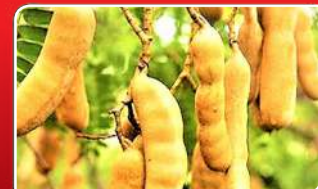
ପୋଷକ ତରୁର ଗନ୍ଧାନ୍ତର ଚେନ୍ଦୁଳି