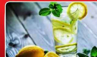
ଇନ୍ଦ୍ରପେକଶନ କମାଏ ଲେମ୍ବୁପାଣି