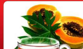
ବାତରକ୍ତରୁ ମୁକ୍ତି ଦେବ ଅମୃତ ଭଣ୍ଡା ବା'