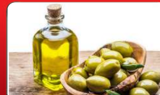
ଦୃଷ୍ଟିଶକ୍ତିକୁ ପ୍ରଖର କରେ ଅଲିଭ୍ ତେଲ