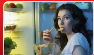
ରାତ୍ର ଭୋଜନ କରି କଥା