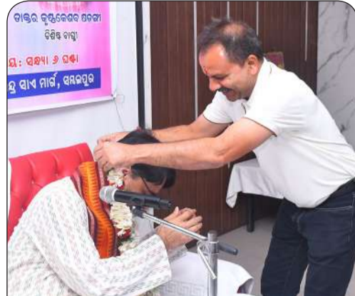
ସାପ୍ତାହିକ 'ସାକାର' ପଞ୍ଚରୁ ଭାଗବତ ଚର୍ଚ୍ଚା