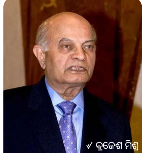
✓ ବୃଜେଶ ମିଶ୍ର

ପିଏମ୍‌ରେ ପ୍ରମୁଖ ସଚିବ ଭାବରେ ସର୍ବାଧିକ କାଳ କାର୍ଯ୍ୟ କରିଥିବା ଅଧିକାରୀ ତାଲିକାର ଶୀର୍ଷ ସ୍ଥାନରେ ରହିବେ ।